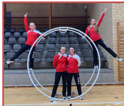
Unsere WM-Turnerinnen 2022