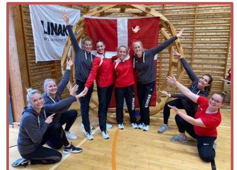
Schweizer Grüsse aus Sonderborg