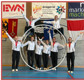
Unsere SM-Turnerinnen 2022

fanden in der Breitli-Halle in Buochs die Schweizer Meisterschaften Rhönrad statt. Acht Untersiggenthalerinnen nahmen an diesem Wettkampf teil. Nach diesem erfolgreichen Tag durften wir voller Stolz verkünden, dass sich vier Turnerinnen des STV Untersiggenthal für die Weltmeisterschaften in Dänemark qualifiziert hatten.